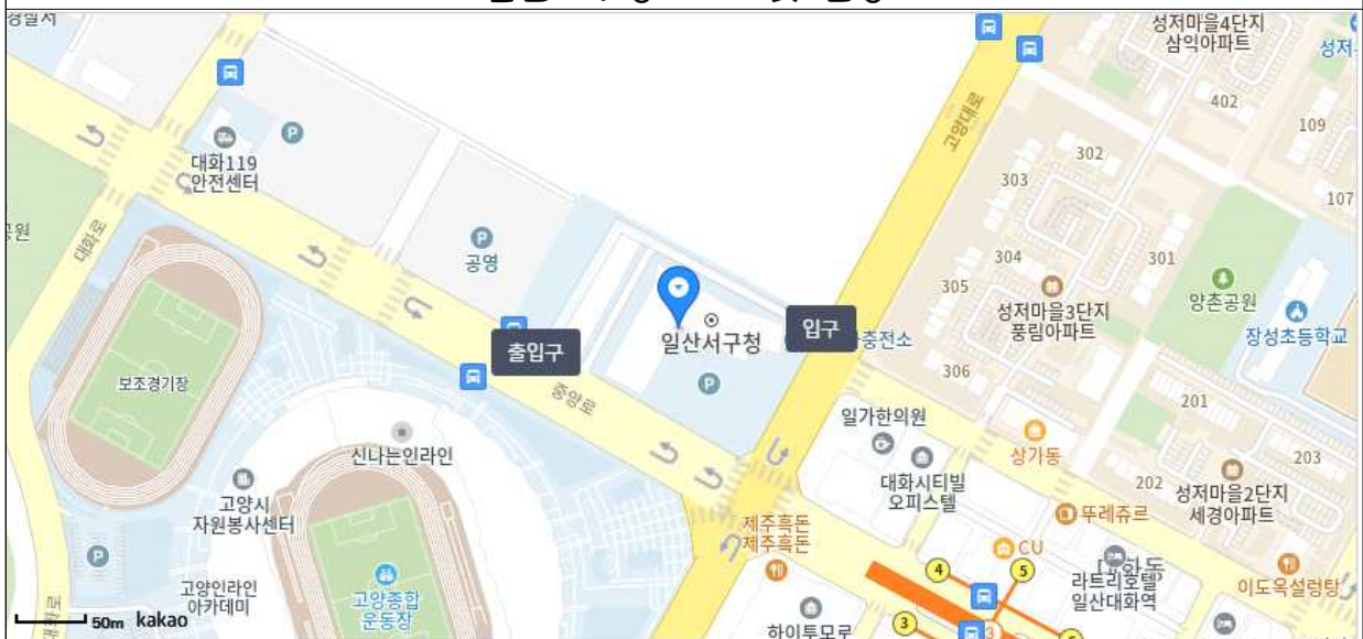
주차장 입구 지도